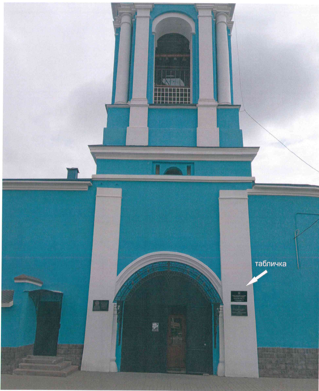
Пути подхода к информационной надписи со стороны улицы Достоевского, высота размещения информационной надписи: 2600 мм.